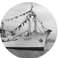
동원산업의 최초 선박 제 31 동원호