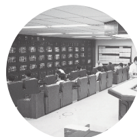
한신증권 인수 (現, 한국투자증권)