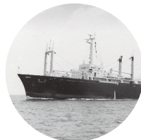
동원의 위상을 바꾼 5천톤급 동산호