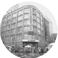
4월 16일: 직원 3명으로 창업

1차 산업인 수산업을 통한 사업기반 구축 및 다각화 모색 10주년 1979년 육영재단 설립