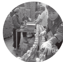
국내 최초 참치캔 발매